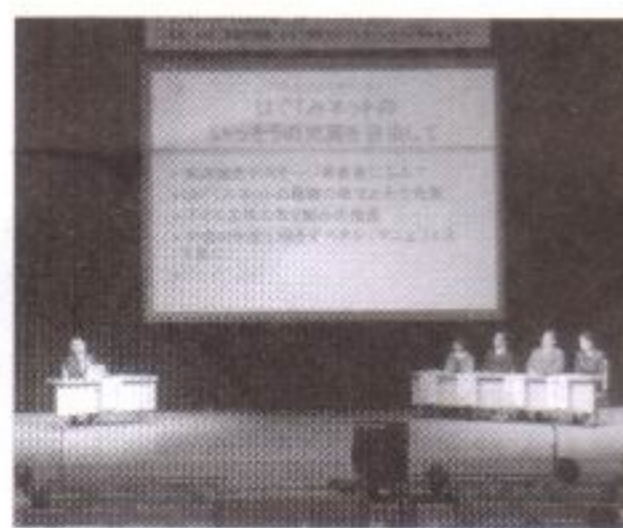
活況を呈した パネルディスカッション

☆三月十二日青少年指導員会主催のエキスポランド遠足は雨天の為中止になりました。 ☆三月十六日花と緑の委員会とPTA共催によるガーデニング講習会が開催されました。 卒業式・入学式に向けて華やかに玄関を彩っています。